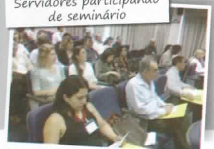
Servidores participando de seminário

Ao longo desses 15 anos, dois concursos públicos foram promovidos e, hoje, 35 profissionais são responsáveis pela concessão dos benefícios e pelo atendimento a aposentados e pensionistas do município de Vitória. Esses servidores, participam de cursos, palestras e congressos na área previdenciária no Espírito Santo e no Brasil, elevando seu nível de formação, sua capacitação e o alto padrão dos serviços públicos.