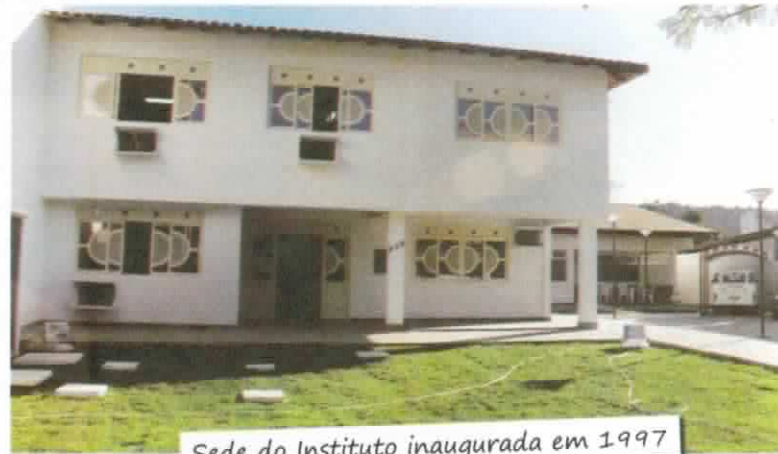
Sede do Instituto inaugurada em 1997

Já em 1994, tal instituição torna-se autarquia do município de Vitória, com personalidade jurídica de Direito Público, patrimônio próprio e autonomia administrativa e financeira. No dia 7 de fevereiro de 1997, nascia o IPAMV para assumir a responsabilidade da execução