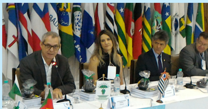
Mesa de abertura da 63ª Reunião do CONAPREV